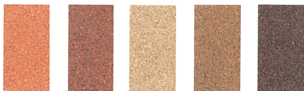
オレンジ レンガ ベージュ ブラウン ココア

受注生産品となっていた300×300×60mmを 10色の中から、人気のアースカラー5色を 通常在庫品 といたします。 100×200×60mm・100×100×60mmは 今まで通り10色在庫しております。