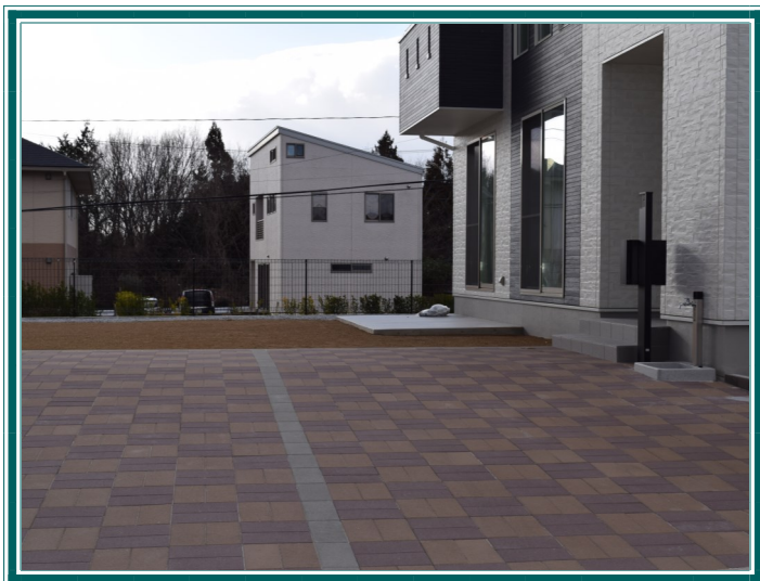
ベース:ココア・ブラウン(市松模様) ライン:グレー